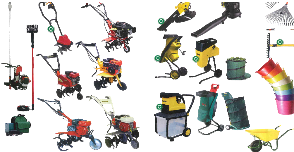
Herramientas y material para el cultivo