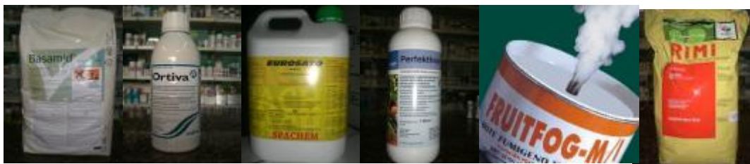
Herbicidas, insecticidas, fungicidas, cicatrizantes, antitranspirantes, etc.