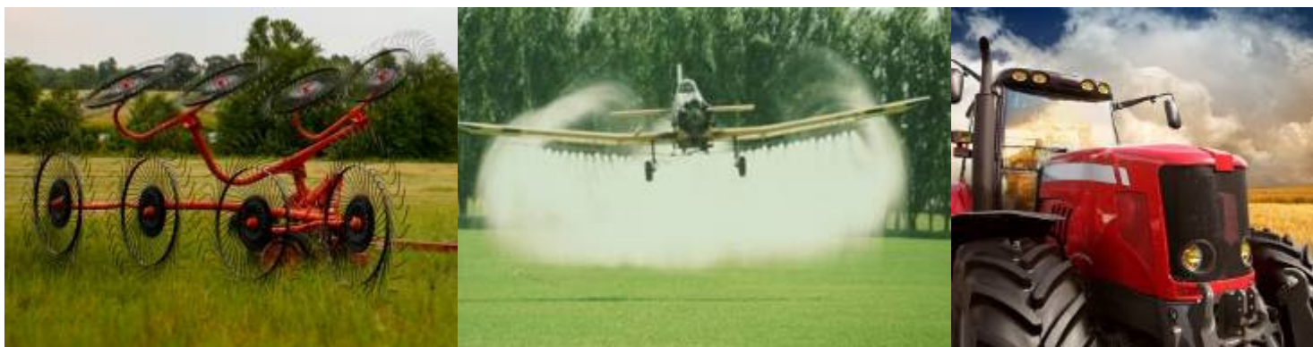
Aperos de labranza, maquinaria comunitaria