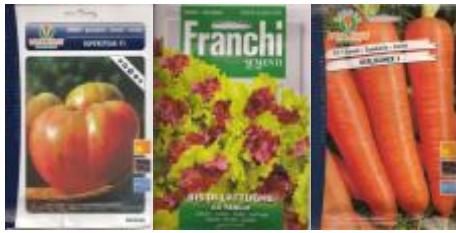
Todo empieza con una buena semilla

GRUPO EUROPEO DE INGENIERÍA AGROALIMENTARIA Y AMBIENTAL